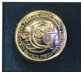
Gambar 23 : Butang saiz 20mm