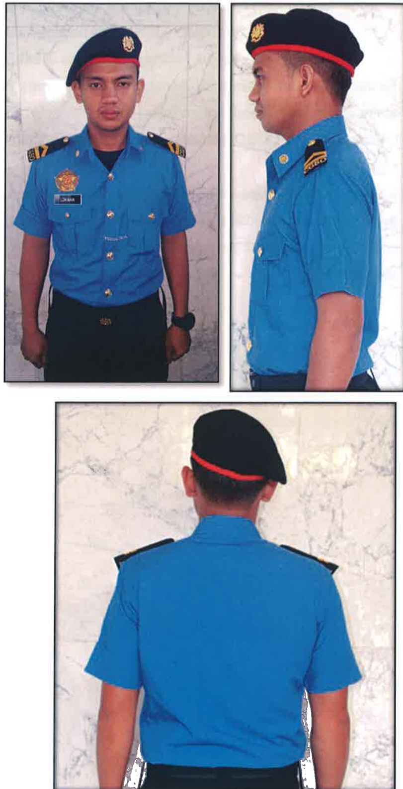
Gambar 2 : Baju Lelaki