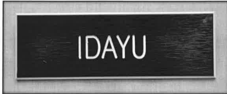
Gambar 27 : Tanda nama

Jika tidak bertudung, potongan rambut mestilah paras bahu diikat sanggul dan disisir rapi. Warna rambut mestilah berwarna natural .