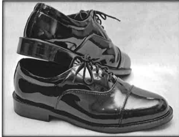
Gambar 4 : Kasut lelaki