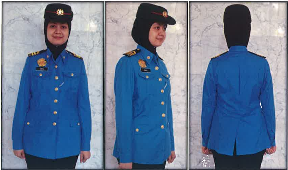
Gambar 16 : Baju Wanita