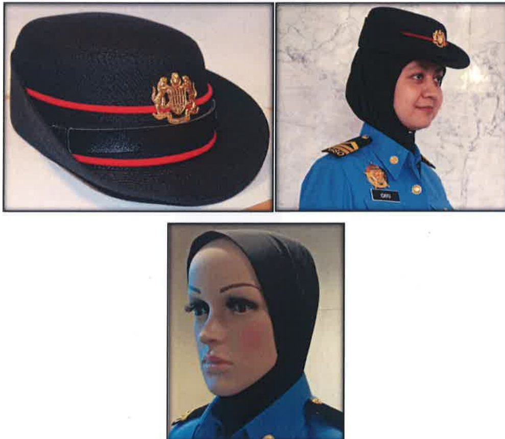
Gambar 15 : Bowler hat dan tudung hitam