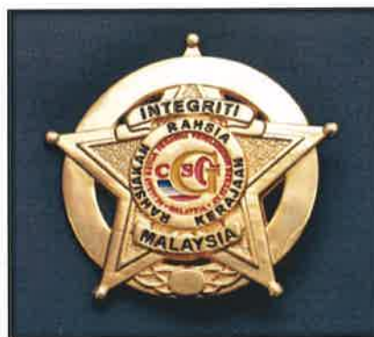
Gambar 26 : Lencana Integriti