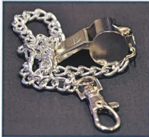
Gambar 22 : Wisel dengan rantai

Diperbuat daripada jenis stainless steel berwarna perak dan tidak mudah karat.