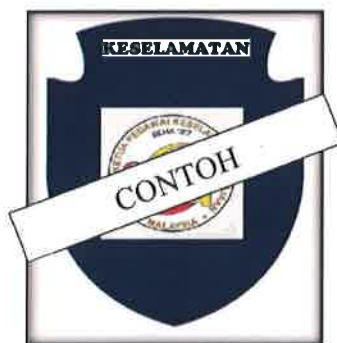
Gambar 7 : Logo Kementerian/ Jabatan/ Agensi