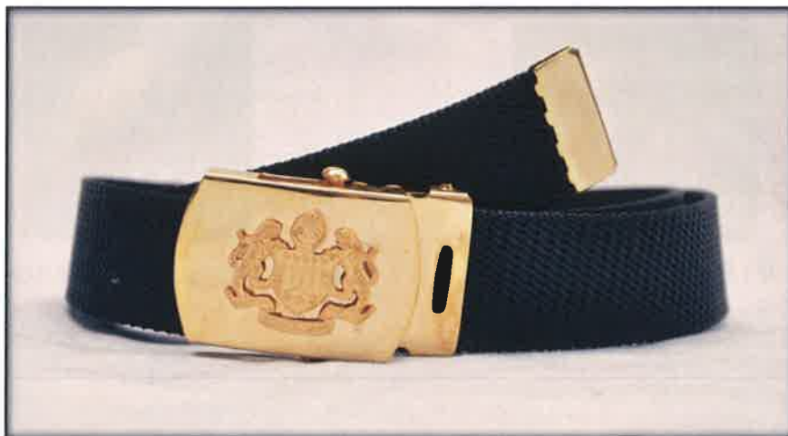
Gambar 12 : Nylon belt

Diperbuat daripada jenis nylon berwarna hitam dengan ketinggian 3cm. Kepala tali pinggang ( buckle ) diperbuat daripada metal plated berwarna emas. Logo Jata Negara hendaklah diembossed / dilekatkan di kepala tali pinggang ( buckle ).