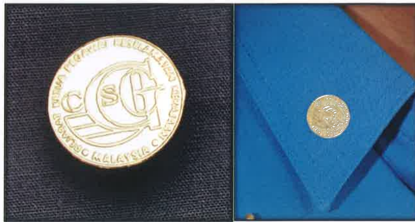
Gambar 6 : Lencana Kolar