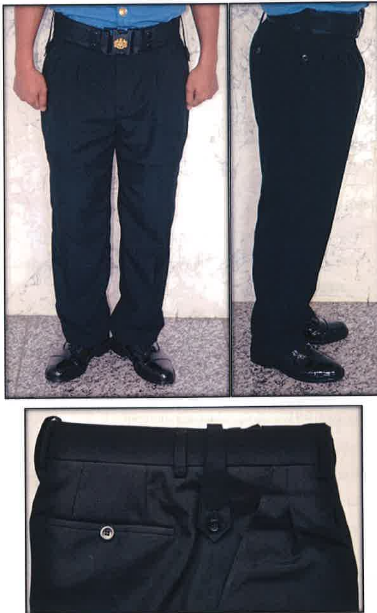
Gambar 3 : Seluar