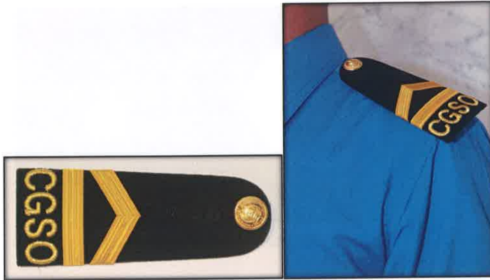
Gambar 5 : Epaulettes

Jalur ( Stripe ) berwarna emas selebar 1cm dijahit pada epaulettes . Tanda pangkat adalah seperti berikut:-