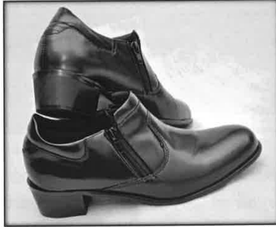
Gambar 18 : Kasut wanita