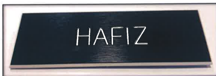
Gambar 14 : Tanda Nama