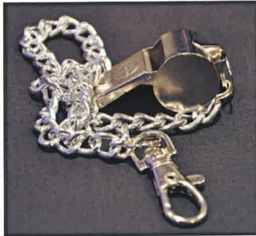
Gambar 8 : Wisel dengan rantai

Diperbuat daripada jenis stainless steel berwarna perak dan tidak mudah karat.