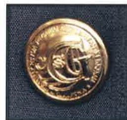
Gambar 24 : Butang saiz 16mm