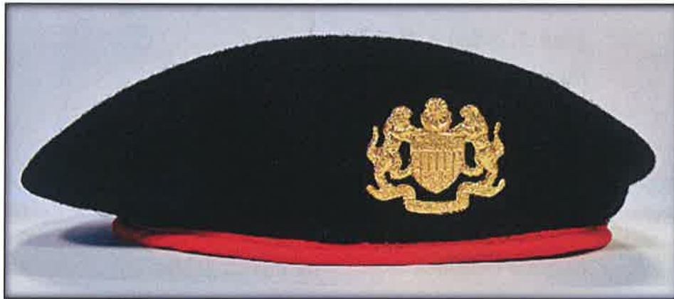
Gambar 1 : Beret