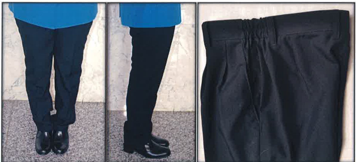
Gambar 17 : Seluar wanita