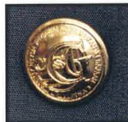
Gambar 10 : Butang saiz 16mm