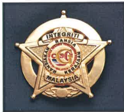
Gambar 13 : Lencana Integriti