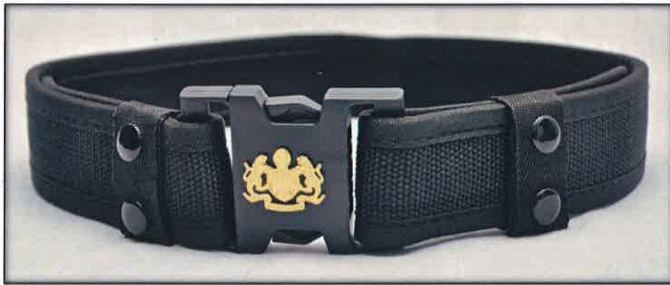
Gambar 11 : Tactical belt

Diperbuat daripada jenis nylon berwarna hitam dengan ketinggian 5cm. Kepala tali pinggang ( buckle ) diperbuat daripada plastik keras yang tahan lasak berwarna hitam. Logo Jata Negara berwarna emas berukuran 3cm x 2.5cm dari jenis metal plated dilekatkan di kepala tali pinggang ( buckle ).