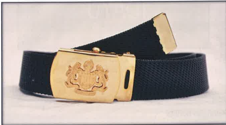
Gambar 25 : Nylon belt

Diperbuat daripada jenis nylon berwarna hitam dengan ketinggian 3cm. Kepala tali pinggang ( buckle ) diperbuat daripada metal plated berwarna emas. Logo Jata Negara hendaklah diembossed / dilekatkan di kepala tali pinggang ( buckle ).