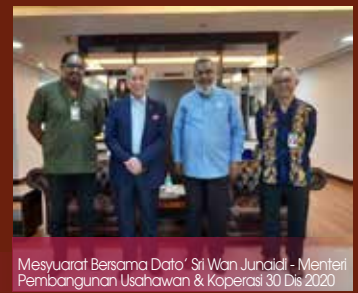
Mesyuarat Bersama Dato' Sri Wan Junaidi - Menteri Pembangunan Usahawan & Koperasi 30 Dis 2020