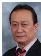
YB Senator Datuk Paul Igai Ahli (Dewan Negara) Sarawak