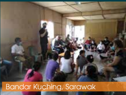
Bandar Kuching, Sarawak