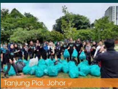
Tanjung Piai, Johor