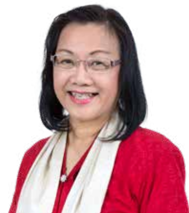
Maria Chin Abdullah Naib Pengerusi APPGM-SDG Ahli Parlimen Petaling Jaya