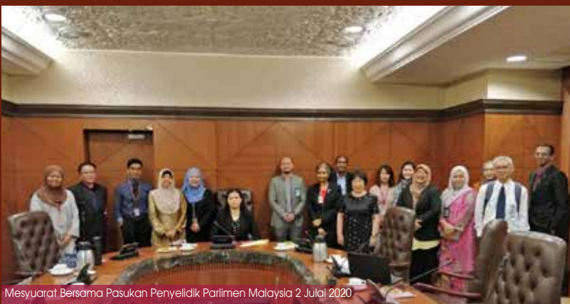
Mesyuarat Bersama Pasukan Penyelidik Parlimen Malaysia 2 Julai 2020