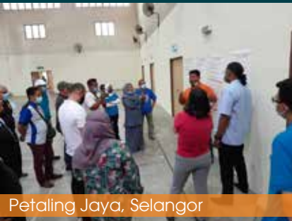
Petaling Jaya, Selangor