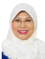
YB Dato' Seri Hajah Rohani Abdul Karim Pengerusi Batang Lupar (P201)

Ahli-ahli Jawatankuasa APPGM-SDG terdiri daripada Ahli-ahli Parlimen (Dewan Rakyat & Negara) yang merangkumi parti kerajaan dan pembangkang. Mereka adalah seperti berikut: