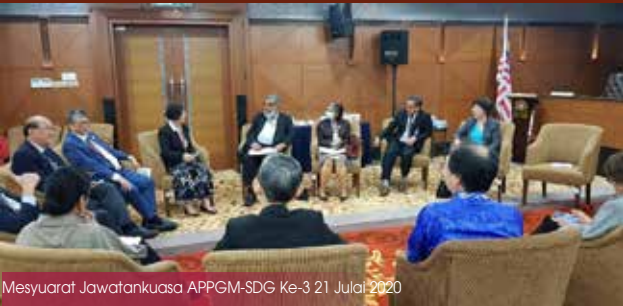
Mesyuarat Jawatankuasa APPGM-SDG Ke-3 21 Julai 2020