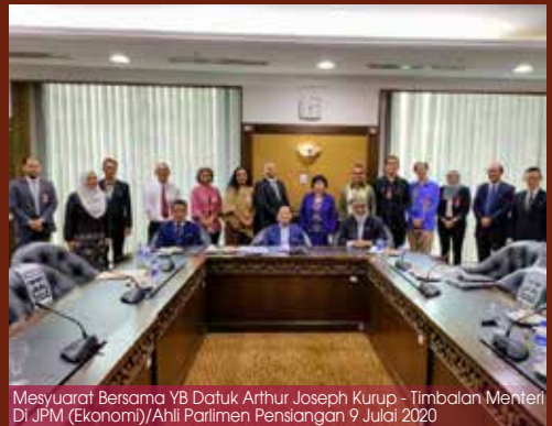
Mesyuarat Bersama YB Datuk Arthur Joseph Kurup - Timbalan Menteri Di JPM (Ekonomi)/Ahli Parlimen Peninsular 9 Julai 2020