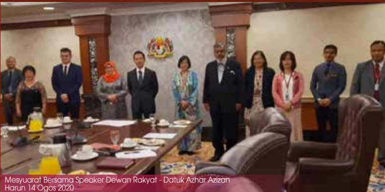
Mesyuarat Bersama Speaker Dewan Rakyat - Datuk Azhar Azizan Harun 14 Ogos 2020