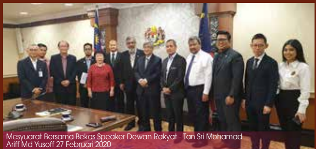
Mesyuarat Bersama Bekas Speaker Dewan Rakyat - Tan Sri Mohamad Ariff Md Yusoff 27 Februari 2020