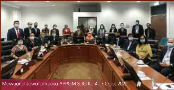
Mesyuarat Jawatankuasa APPGM-SDG Ke-4 17 Ogos 2020