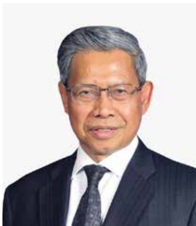
YBM Dato' Sri Mustapa Mohamed Menteri di Jabatan Perdana Menteri (Ekonomi)

Sekalung tahniah kepada Kumpulan Rentas Parti Parlimen Malaysia Mengenai Matlamat Pembangunan Lestari - "All-Party Parliamentary Group Malaysia on Sustainable Development Goals (APPGM-SDG) di atas penerbitan Laporan Tahunan 2020 ini.