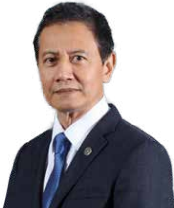
DATUK AZHAR AZIZAN HARUN