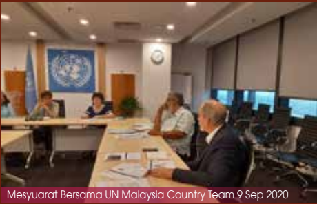
Mesyuarat Bersama UN Malaysia Country Team 9 Sep 2020