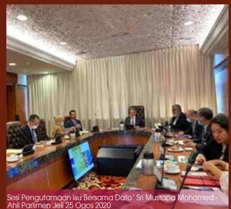
Sesi Pengutamaan Isu Bersama Dato' Sri Mustapa Mohamed - Ahli Parlimen Jelai 25 Ogos 2020