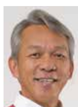
YB Tuan Wong Tack Ahli (Dewan Rakyat) Bentong (P089)