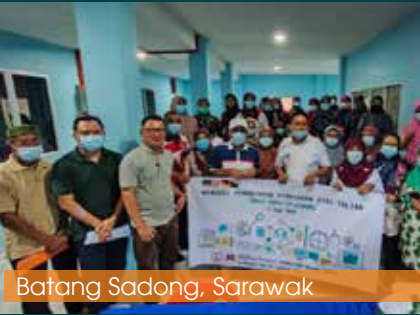
Batang Sadong, Sarawak