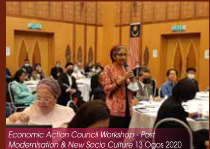
Economic Action Council Workshop - Post Modernisation & New Socio Culture 13 Ogos 2020