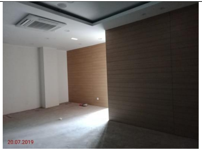
Aras 3 – Bilik kementerian