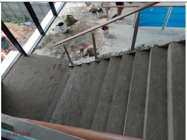
Aras 2 – Tangga 7 ke Link Bridge