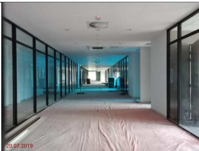
Aras 1- Lalan Bilik MP