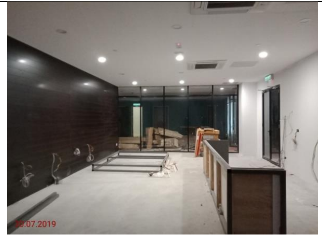
Aras 1 – Bussiness Centre