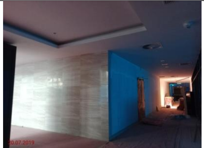
Aras Tanah – Lalan tepi Perpustakaan