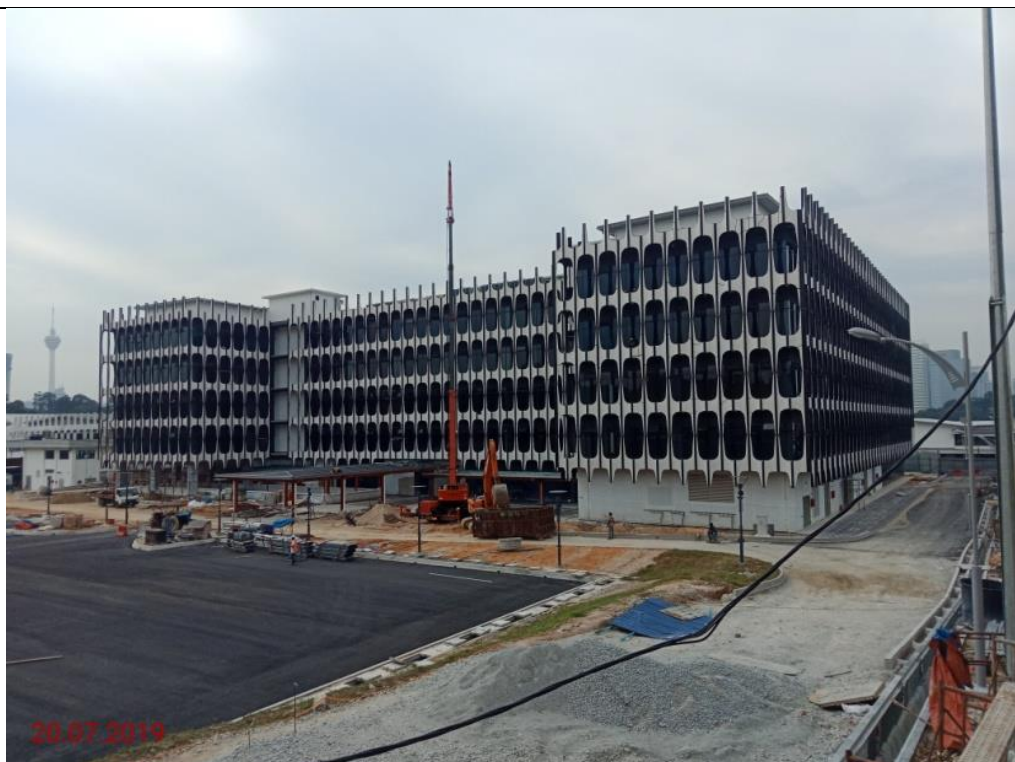
Blok MP - Pandangan Belakang