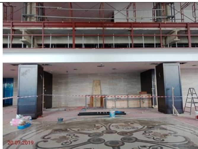
Kaunter Hadapan – Lobi Utama