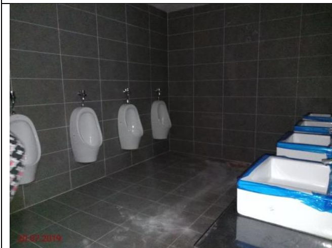
Aras 1 – Tandas