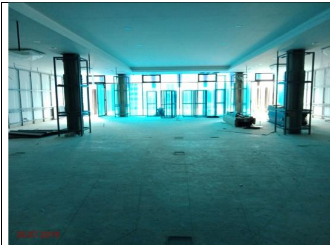
Aras 3 – Bilik Mesyuarat 50 pax