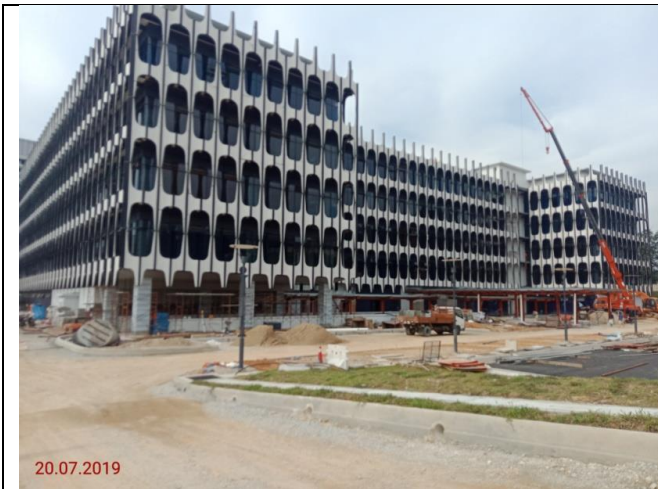
Pemasangan Fasad Zon C