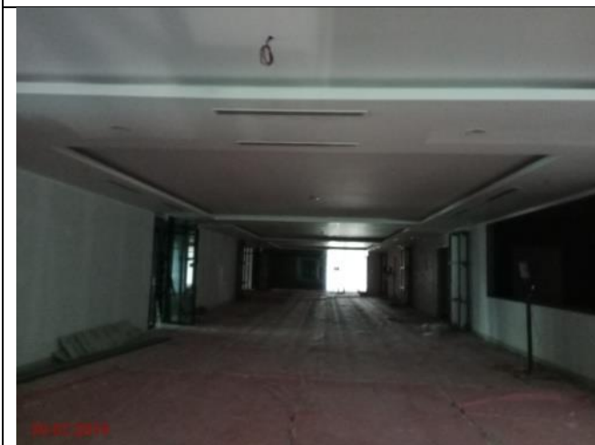
Aras 2 – Laluan