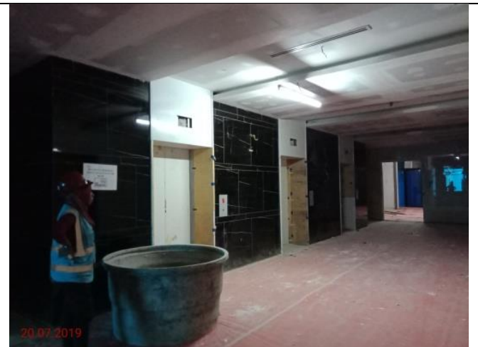
Aras 4 – Lif Lobi