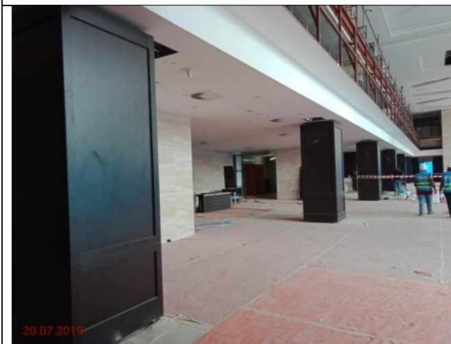
Lobi Utama – Aras Tanah