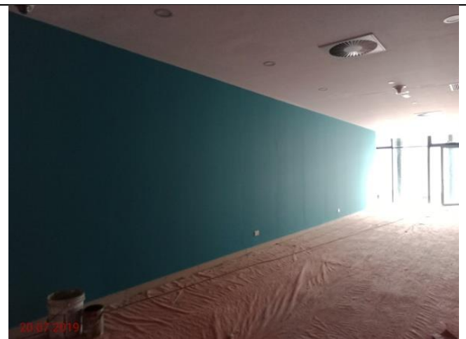
Aras 1 – Lalan