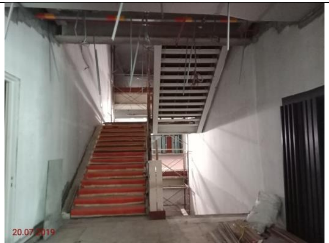
Aras 1- Pintu Tangga 2