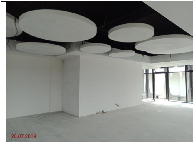
Aras 1 - Gimnasium