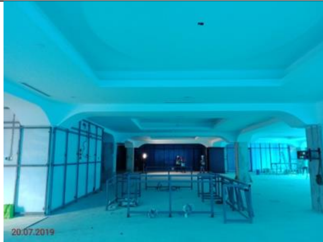
Aras Tanah - Perpustakaan