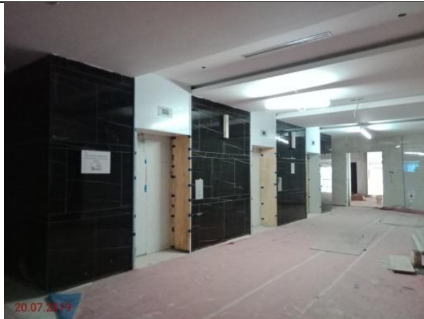
Aras 1 – Lif Lobi