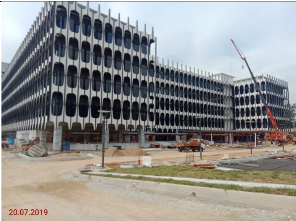
Blok MP - Pandangan Sisi