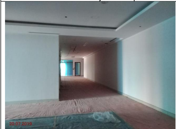
Aras 3 – Laluan