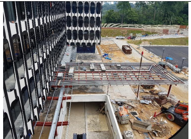
Covered Walkway Blok MP