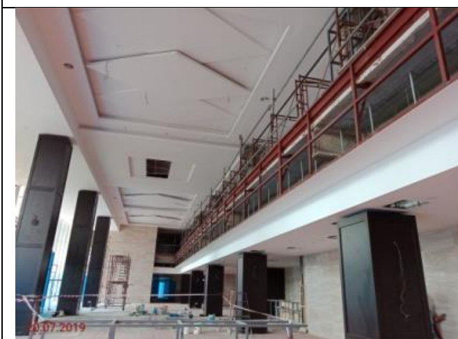
Aras Tanah – Main Lobby