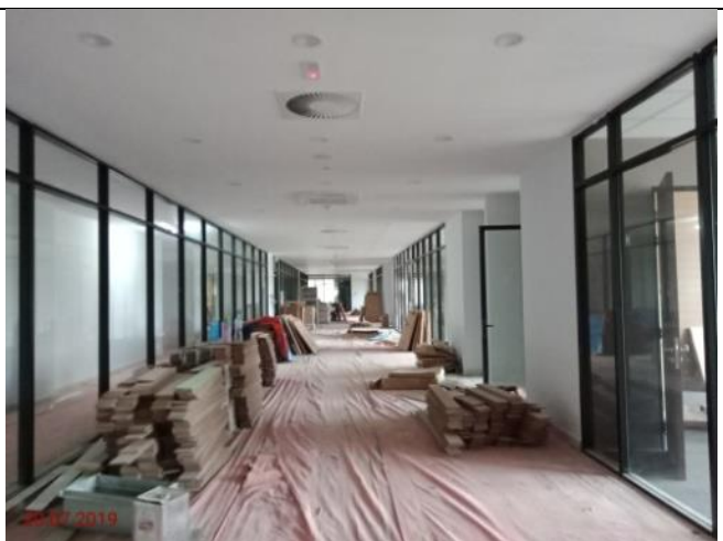
Aras 2 – Laluan Bilik MP