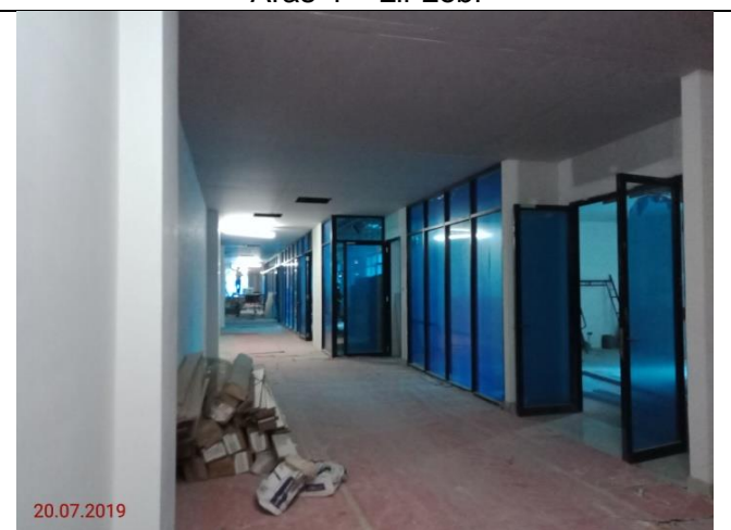
Aras 4 – Laluan